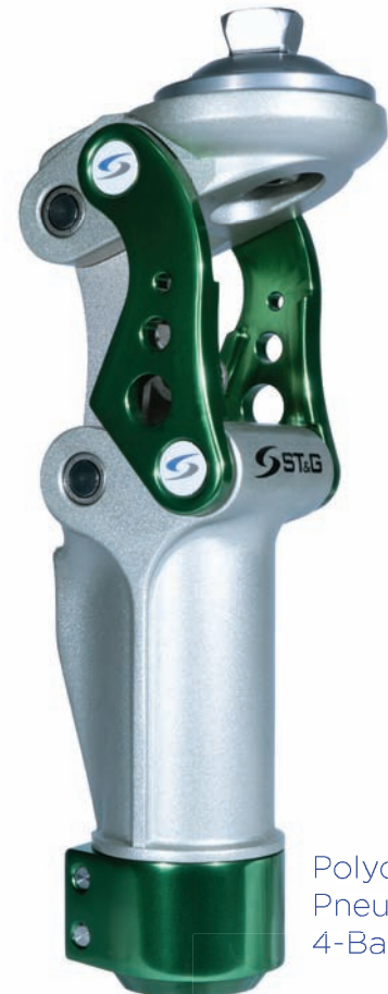
Polycentric Pneumatic 4-Bar Knee

Ortho Europe Benelux www.ortho-europe.nl info@ortho-europe.nl +31 (0)30 634 1681