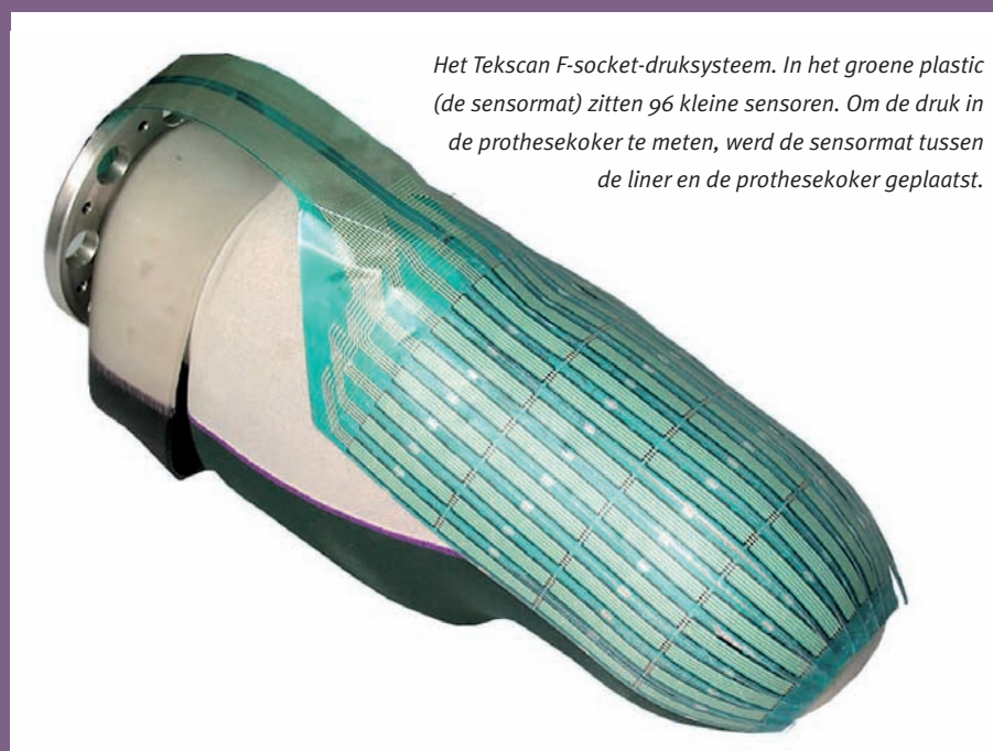
Het Tekscan F-socket-druksysteem. In het groene plastic (de sensormat) zitten 96 kleine sensoren. Om de druk in de prothesekoker te meten, werd de sensormat tussen de liner en de prothesekoker geplaatst.