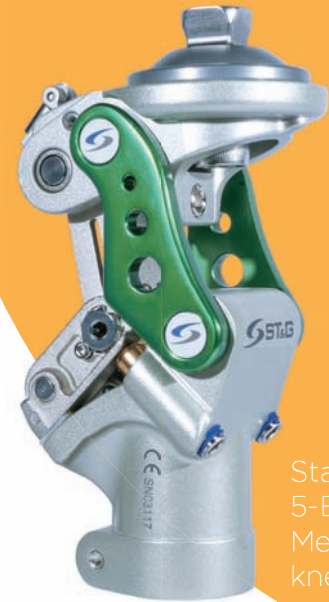
Stance Flexion 5-Bar Mechanical knee