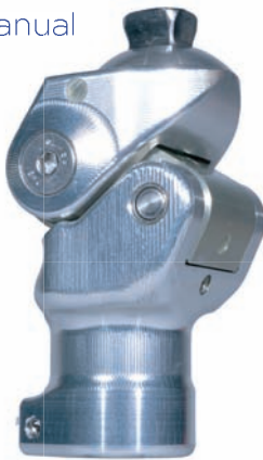
Weight-activated Brake Knee with Manual Lock