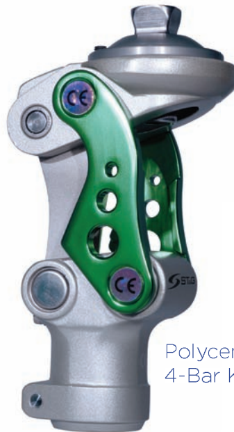
Polycentric 4-Bar Knee