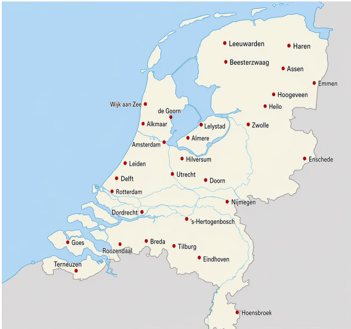
Afbeelding 1: Geografisch overzicht structurele inlopmomenten lotgenotencontact KMK